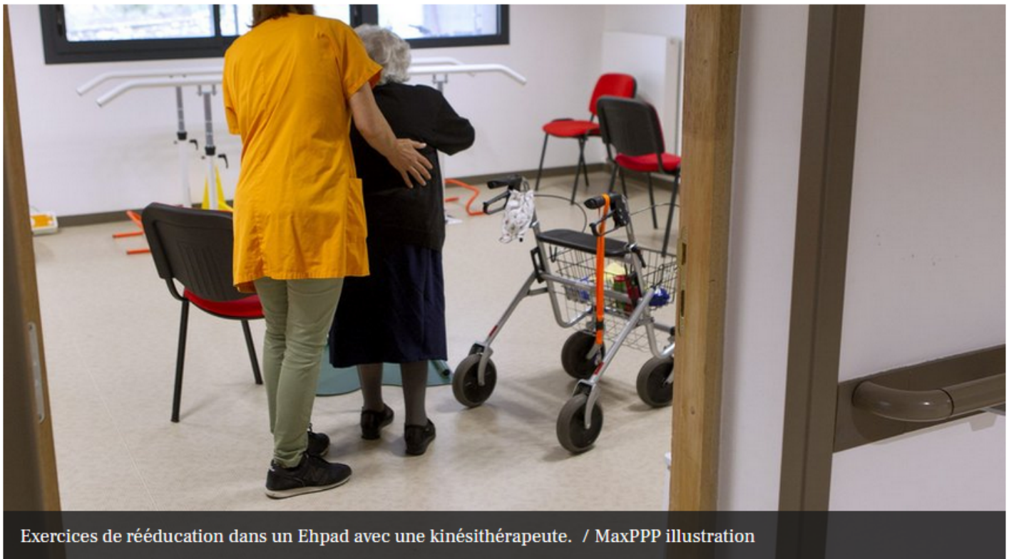
Exercices de rééducation dans un Ehpad avec une kinésithérapeute.